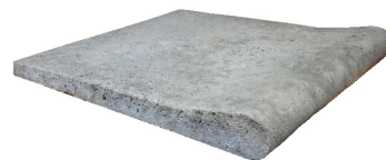
Borde Recto Rodon Alto