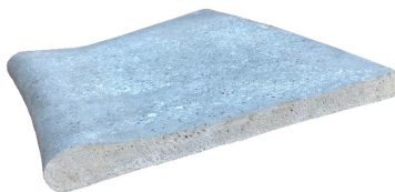
Borde Radio Rodon Alto