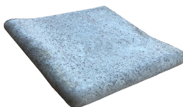
Borde Escuadra Rodon Alto