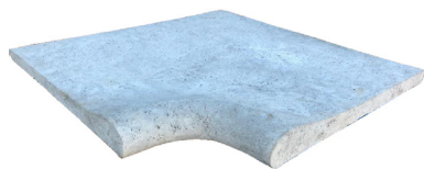
Borde Esquina Curvo Rodon Alto