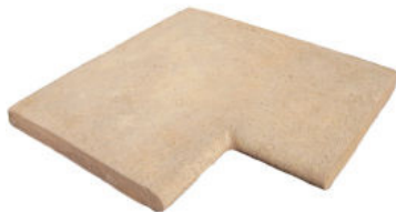
Borde Esquina Recto