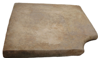
Borde Esquina Curvo